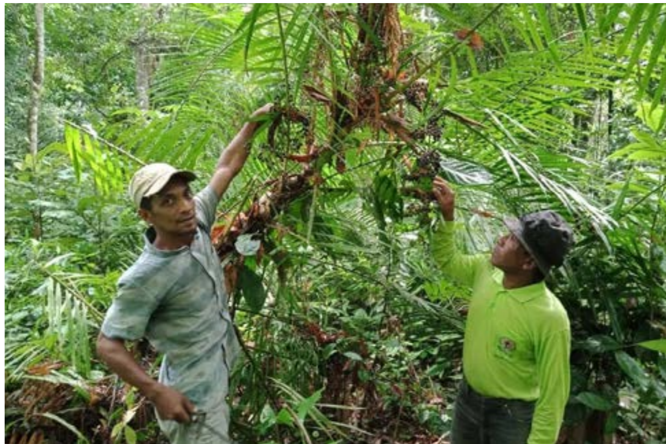
Peserta dan panitia pelatihan jurnalisisme warga saat berkunjung ke LPHD Bale Redelong, Kecamatan Bukit, Kabupaten Bener Meriah, Aceh. Peserta mengumpulkan informasi tentang pengelolaan hutan desa. Foto Dok FJL Aceh

Air terjun ini sudah menjadi salah satu ekowisata alam yang terdaftar dalam rencana tata ruang dan rencana tata kelola kabupaten bireuen. Pada tahun 2023, nanti akan ada pembangunan pendukung untuk menarik wisata tersebut.