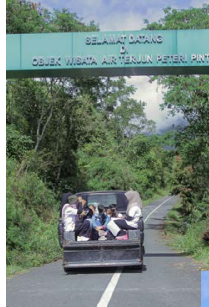
Peserta dan panitia pelatihan jurnalisisme warga saat berkunjung ke LPHD Bale Redelong, Kecamatan Bukit, Kabupaten Bener Meriah, Aceh. Peserta mengumpulkan informasi tentang pengelolaan hutan desa.

Desa Bale Redelong berjarak 2,5 kilometer dari Simpang Tiga Redelong, ibu kota Bener Meriah. Jalan menuju ke sana aspal yang mulus. Perjalanan menuju ke Bale Redelong tidak membosankan. Sepanjang jalan disugahi perkebunan kopi, hortikultura, dan gunung api Burni Telong.