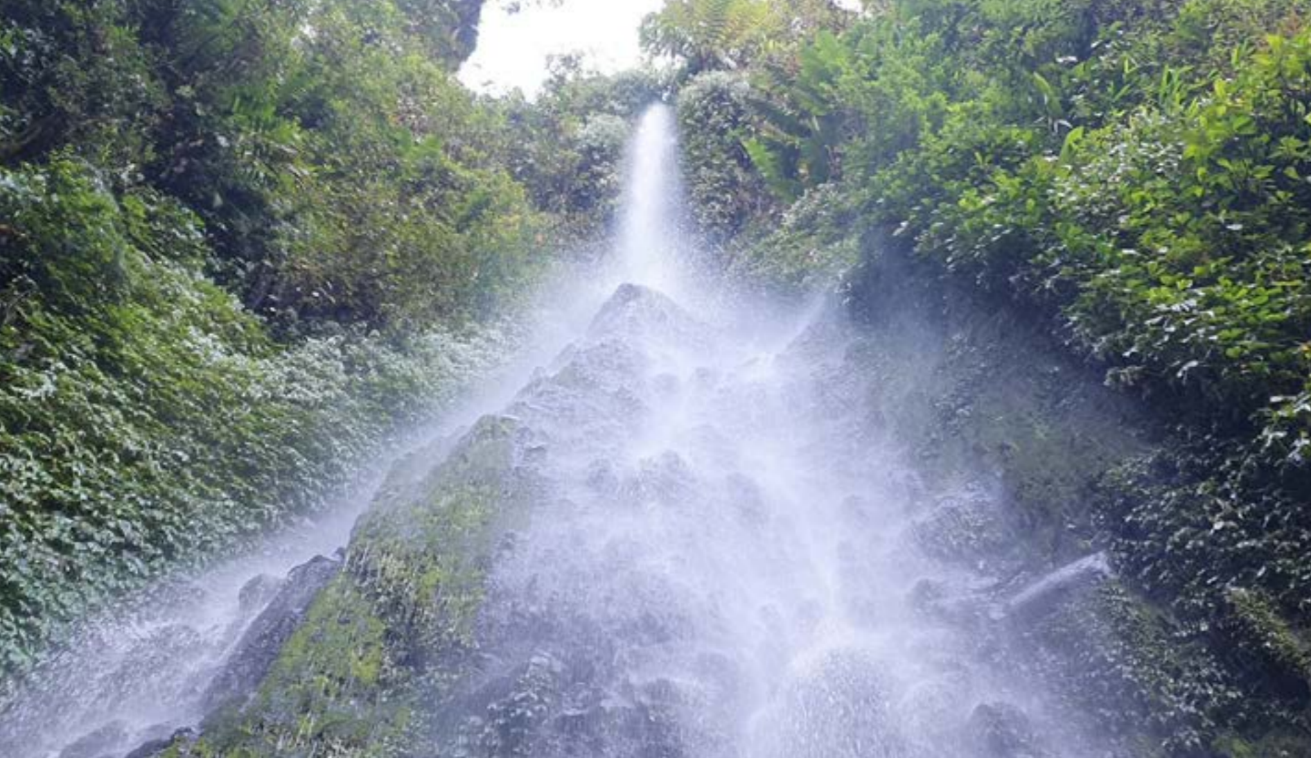
Peserta dan panitia pelatihan jurnalisisme warga saat berkunjung ke LPHD Bale Redelong, Kecamatan Bukit, Kabupaten Bener Meriah, Aceh. Peserta mengumpulkan informasi tentang pengelolaan hutan desa.