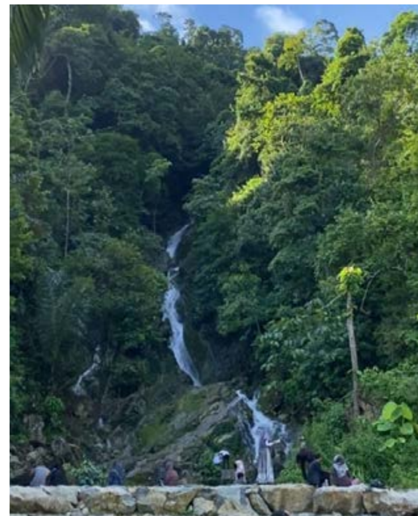
Peserta dan panitia pelatihan jurnalisisme warga saat berkunjung ke LPHD Bale Redelong, Kecamatan Bukit, Kabupaten Bener Meriah, Aceh. Peserta mengumpulkan informasi tentang pengelolaan hutan desa.