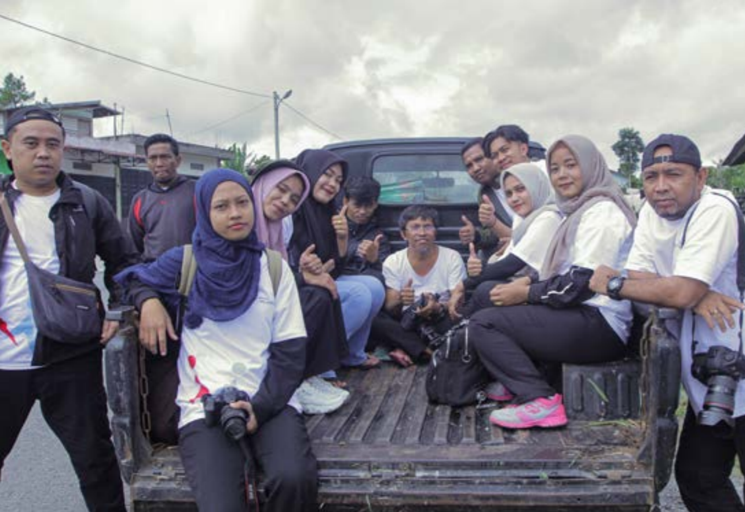
Peserta dan panitia pelatihan jurnalisisme warga saat berkunjung ke LPHD Bale Redelong, Kecamatan Bukit, Kabupaten Bener Meriah, Aceh. Peserta mengumpulkan informasi tentang pengelolaan hutan desa.