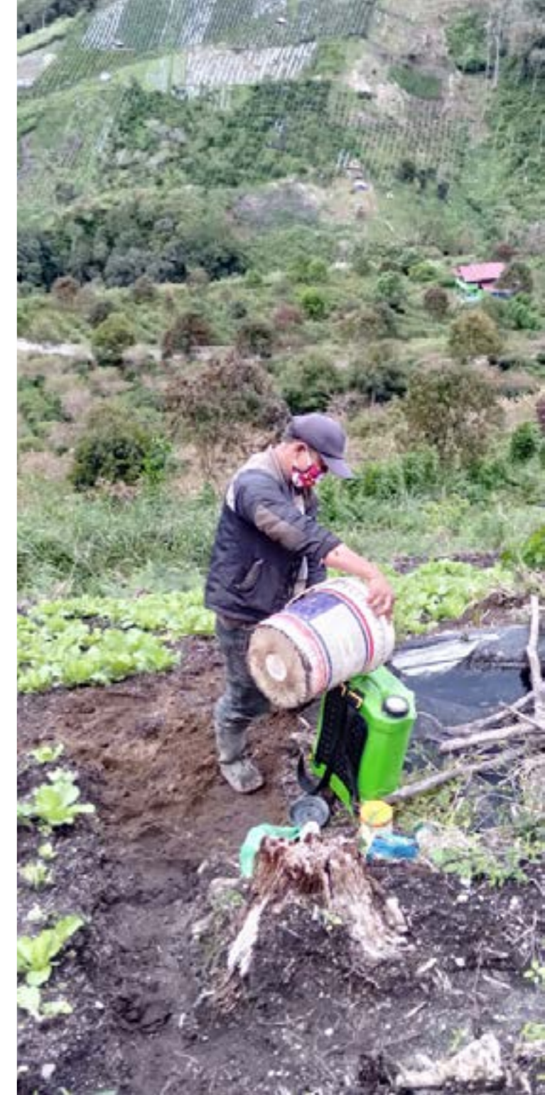
Pemandangan air terjun Peteri Pintu di Desa Bale Redelong, Kecamatan Bukit, Kabupaten Bener Meriah masuk dalam pengelolaan LPHD Bale Redelong.