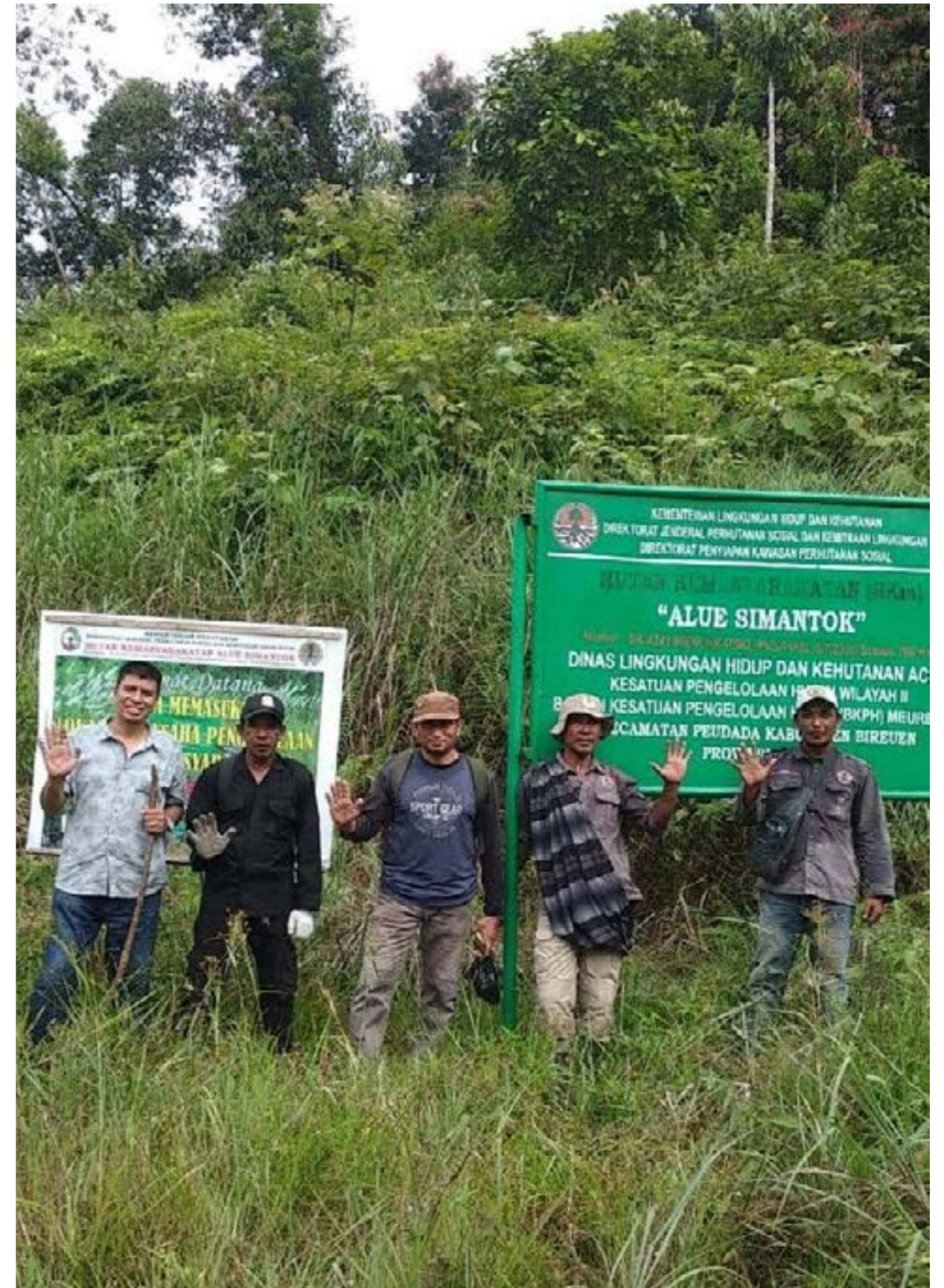
Peserta dan panitia pelatihan jurnalisisme warga saat berkunjung ke LPHD Bale Redelong, Kecamatan Bukit, Kabupaten Bener Meriah, Aceh. Peserta mengumpulkan informasi tentang pengelolaan hutan desa.