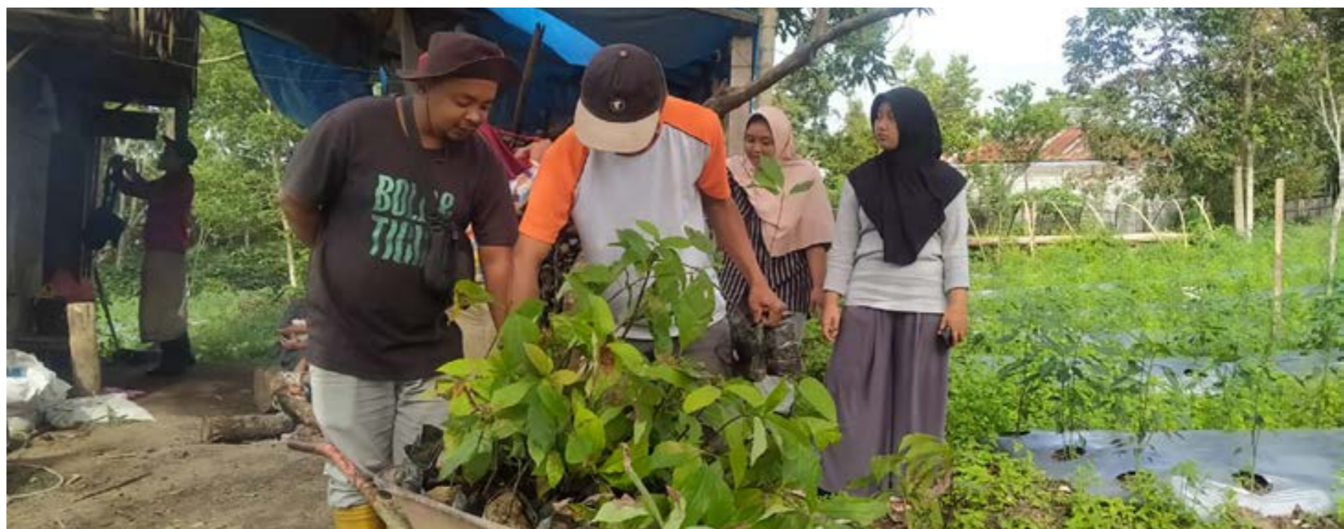
Peserta dan panitia pelatihan jurnalisisme warga saat berkunjung ke LPHD Bale Redelong, Kecamatan Bukit, Kabupaten Bener Meriah, Aceh. Peserta mengumpulkan informasi tentang pengelolaan hutan desa.

Pihak LPHK bekerjasama dengan aparaturnya desa berencana membangun Bukit Mulie dengan konsep desa wisata berbasis perkebunan kopi, Ekologi, dan Ecopark dan mempunyai blueprint yang terencana dan terukur baik jangka pendek, menengah maupun panjang.