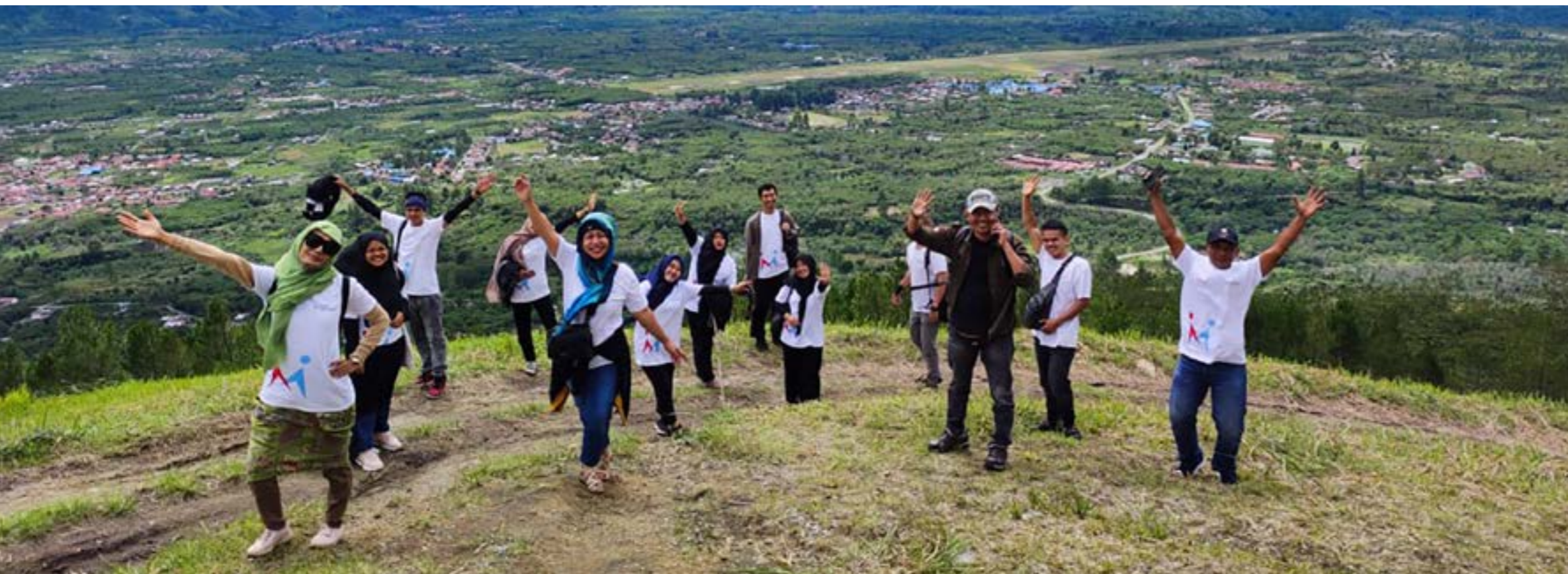
Pemandangan air terjun Peteri Pintu di Desa Bale Redelong, Kecamatan Bukit, Kabupaten Bener Meriah masuk dalam pengelolaan LPHD Bale Redelong.

Ada juga petani yang menanam alpukat untuk pelindung kopi agar tidak terkena cahaya matahari secara langsung. Petani pun juga bisa memanen buah alpukat. Jadi untuk meningkatkan ekonomi para masyarakat di sekitar Bukit Merah Putih mengelola perhutanan sosial