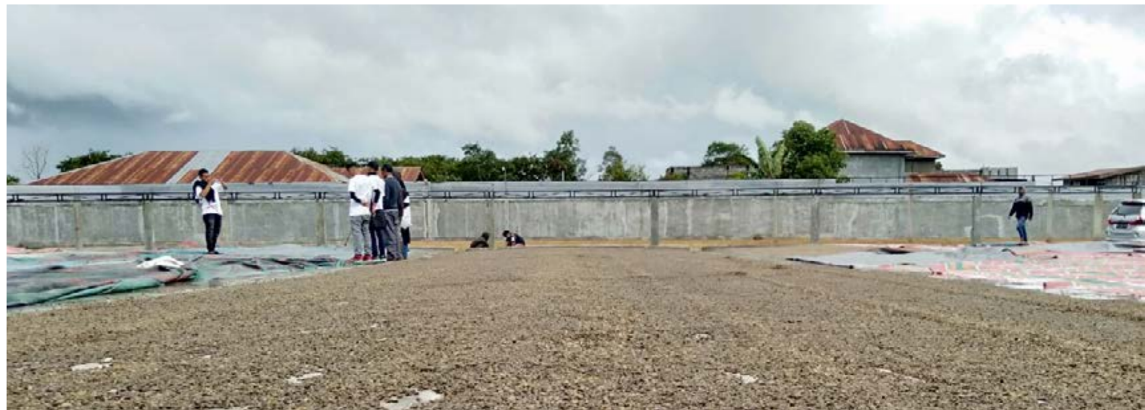
Peserta melihat proses pengolahan kopi di LPHD Bale Redelong bagian dari usaha kelompok.

Artikel ini sudah tayang di https://fjlaceh.org/peserta-pelatihan-jw-berkunjung-ke-kampung-bale-redelong/