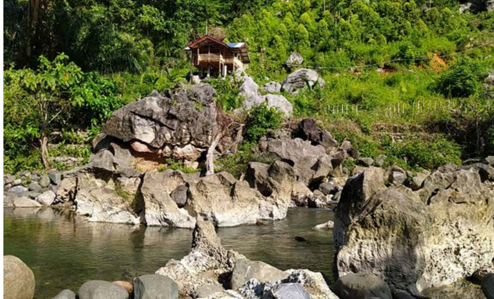
Peserta dan panitia pelatihan jurnalisisme warga saat berkunjung ke LPHD Bale Redelong, Kecamatan Bukit, Kabupaten Bener Meriah, Aceh. Peserta mengumpulkan informasi tentang pengelolaan hutan desa.

Hamdani berharap kedepannya KTH ini memberikan banyak dampak positif bagi masyarakat sekitar gampong pudeng, baik dari hasil hutan maupun ekowisata air terjun.